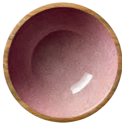
6 MINERAL ROSE