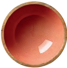
4 BRUSH CORAL