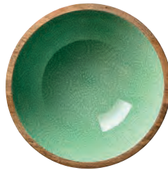
3 BRUSH GREEN