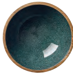
5 MINERAL COAL